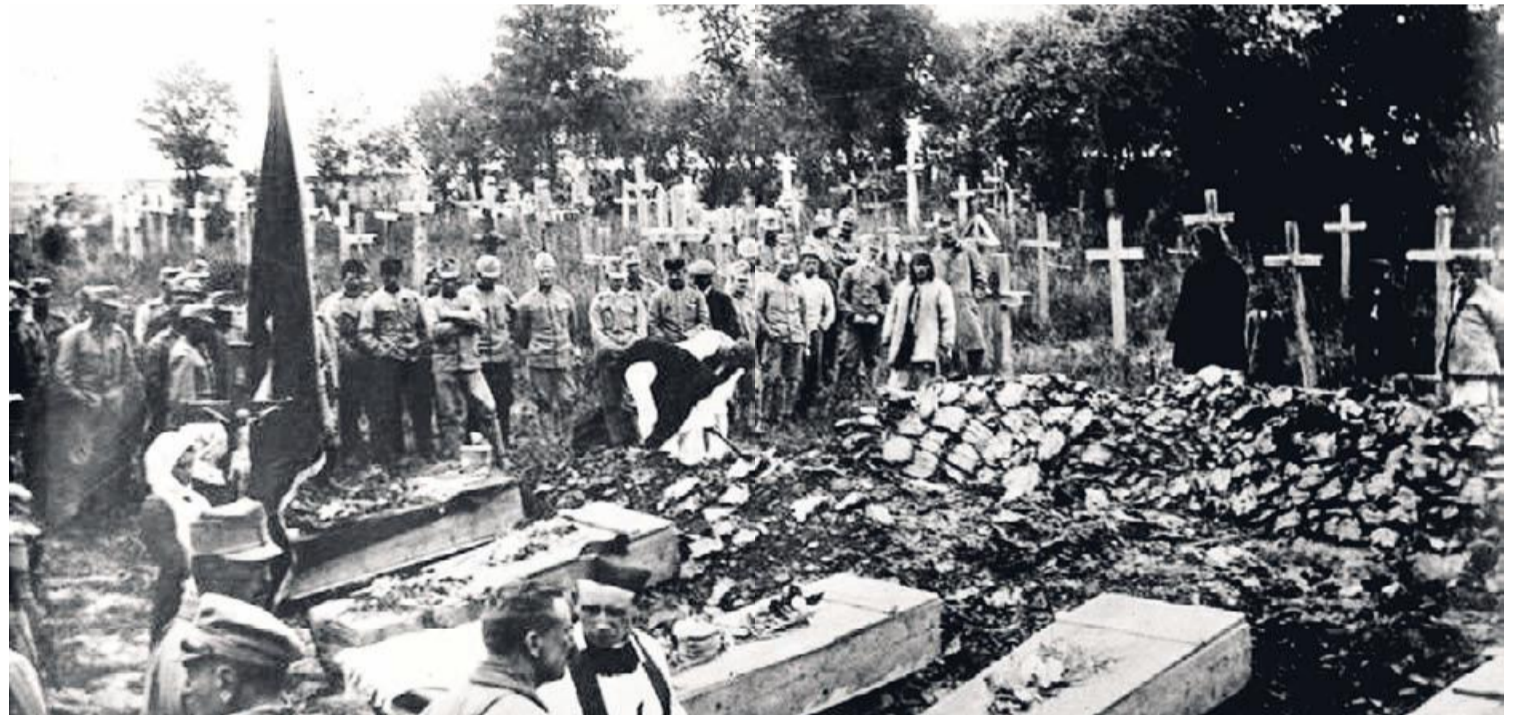
Pogrzeb ułanów poległych podczas szarży pod Rokitną (1915 r.)