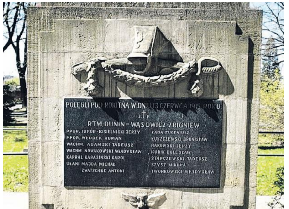
Pomnik bohaterów spod Rokitnej na Cmentarzu Rakowickim w Krakowie.