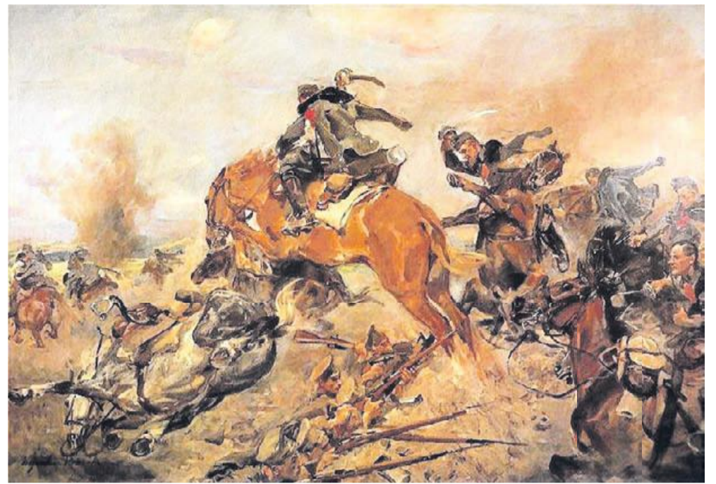
Wojciech Kossak: Szarża pod Rokitną (1934)