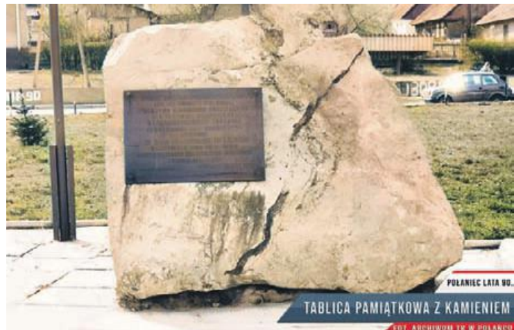
POLANIEC LATA 80. TABLICA PAMIĄTKOWA Z KAMIENIEM