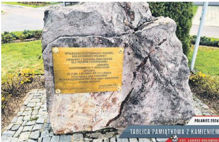
POLANIEC 2024 TABLICA PAMIĄTKOWA Z KAMIENIEM