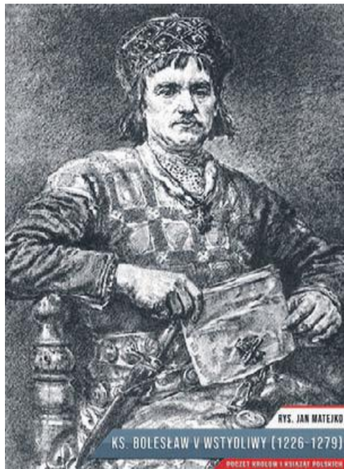
RYT. JAN MATEJKO KS. BOLESŁAW V WSTYDLIWI (1226-1279) PROJEKT WYKONANIE I WYKAZ POLSKICH