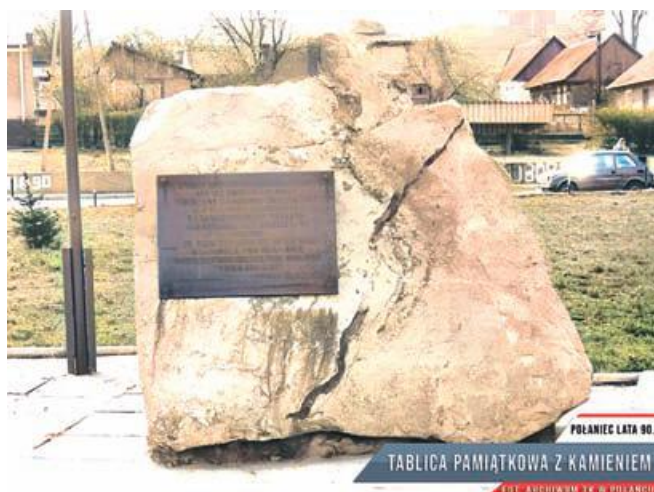
POLANIEC LATA 80.