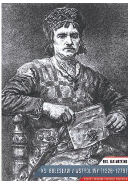
KS. BOLESŁAW V WSTYDLIWY [1226-1279]