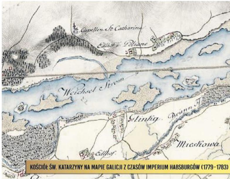
KOŚCIÓŁ ŚW. KATARZYNY NA MAPIE GALICJI Z CZASÓW IMPERIUM HABSBUROW (1779-1783)

Kościół na Winnej Górze był miejscem modlitwy, obrzędów religijnych i spotkań społeczności, które ceniły świętość oraz dobroczynność swojej patronki. Św. Katarzyna - patronka filozofów i młynarzy, znana również jako Katarzyna Dziewica Męczenniczka Aleksandryjska, żyła w IV wieku. Jej kult rozpowszechnił się na całym świecie, a także w Polsce, gdzie wiele kościołów nosi jej imię. Zarówno architektura kościoła jak i wystrój były pełne symboliki i znaczenia dla miejscowych wiernych. Kościół miał posiadać trzy ołtarze. Pierwszy św. Katarzyny na wschodniej ścianie kościoła, drugi ołtarz św. Antoniego Padewskiego, natomiast trzeci ołtarz przedstawiał św. Barbare, patronkę dobrej śmierci. Znajdował się tam również gotycki obraz matki Boskiej na podkładzie kredowym z XV w.