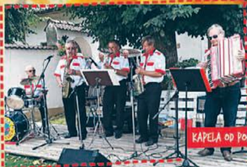
KAPELA OD POŁAŃCA