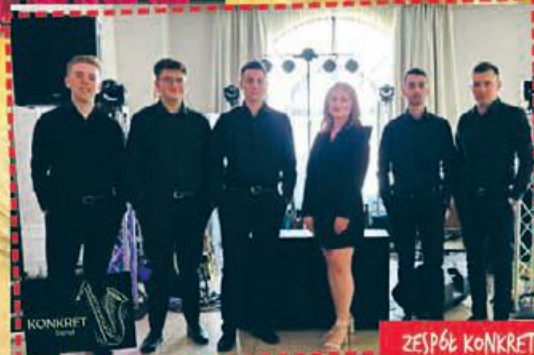
ZESPÓŁ KONKRET BAND