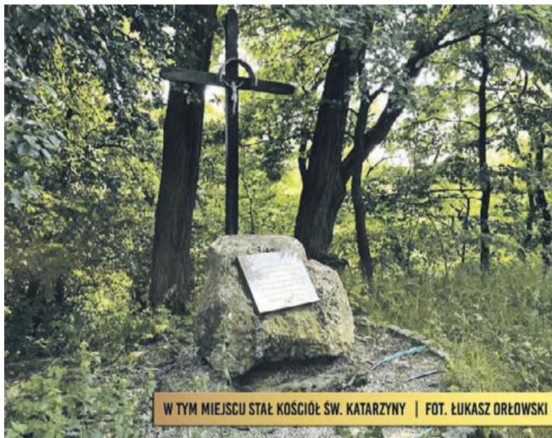
W TYM MIEJSCU STAŁ KOŚCIÓŁ ŚW. KATARZYNY