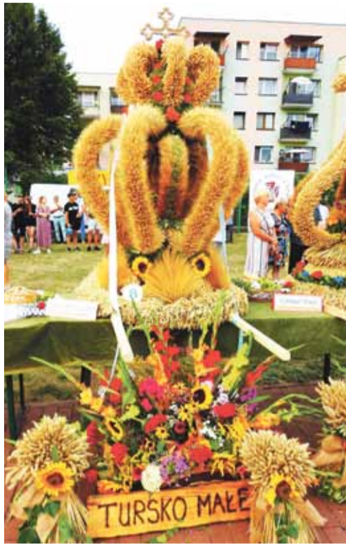
Drugie miejsce Tursko Małe

Zwycięzcą tegorocznego konkursu został wieńiec wykonany przez mieszkańców sołectwa Tursko Małe Kolonia i będzie reprezentował naszą gminę na Dożynkach Powiatowych. ➔