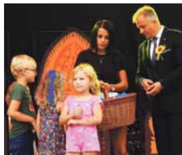
Nagrody dla najmłodszych.