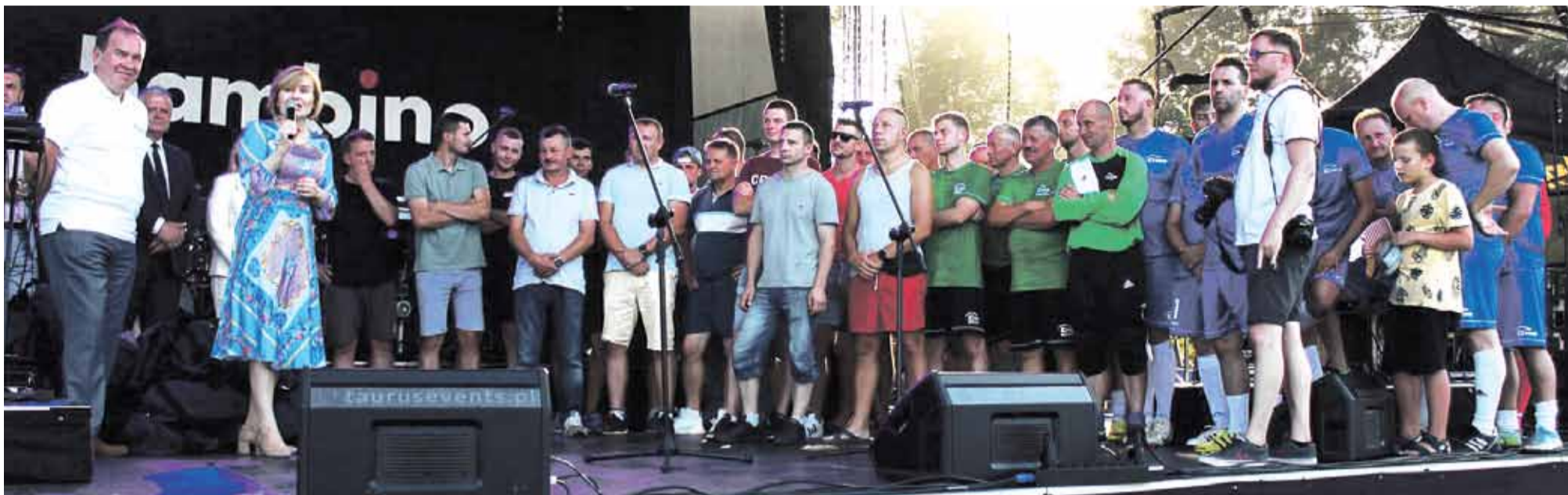
27.08.2022. Połaniec. Dzień Energetyka. Na zdjęciu wszystkie drużyny, które wzięły udział w meczu o puchar Prezesa Enei Elektrowni Połaniec