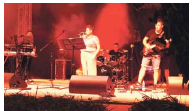
Na zakończenie Dożynek tradycyjnie odbyła się „zabawa pod chmurką”. Najwytrwalszym uczestnikom imprezy zagrał zespół „Retro Band”.