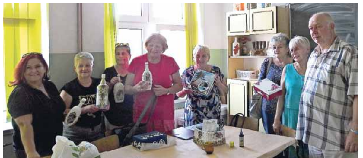
Zdjęcie grupowe uczestników warsztatów plastycznych z instruktorem.

Miejsce warsztatów: siedziba Klubu Megawat (Zespół Szkół im. Oddziału Partyzanckiego AK Jędrusie).