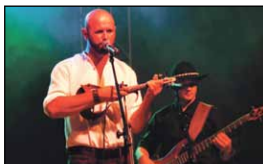
Gwiazdą wieczoru był zespół góralski „Parzenica”. Żywiołowość i temperament są dominującymi cechami nie tylko samej góralskiej muzyki, ale również interpretacji artystów. Entuzjazm z elementami spontaniczności to cechy wykonawców tego góralskiego zespołu. Znakomicie wykonali nie tylko typowe piosenki góralskie, ale również utwory w innych rytmach.