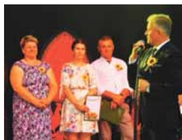
Podziękowania dla Kół Gospodyń Wiejskich.