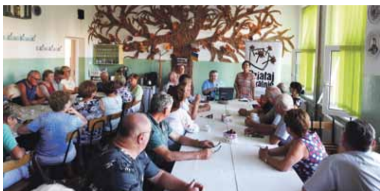
Seniorzy aktywnie uczestniczący w warsztatach psychologicznych