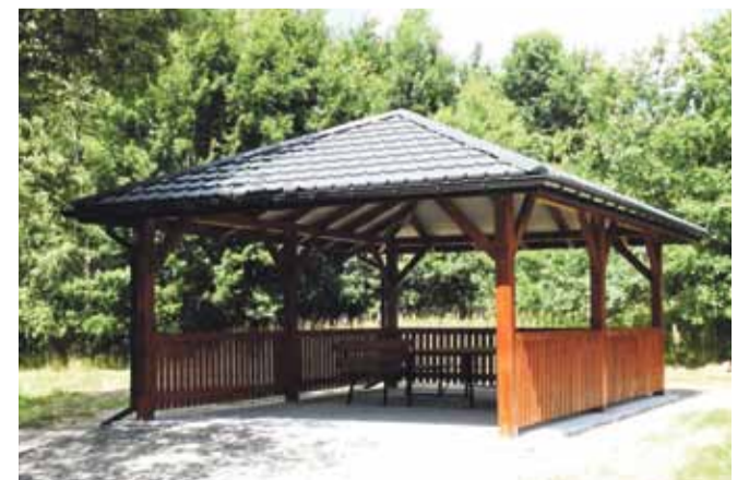
BRZOZOWA – 39 433,60 zł brutto