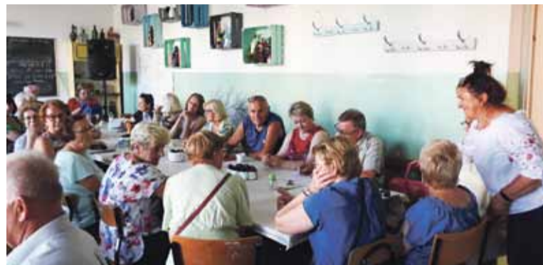
Miejsce warsztatów z psychologiem: siedziba Klubu „Megawat”

Tematyka bardzo ciekawych zajęć dotyczyła pozytywnego myślenia. Mogłoby się wydawać, że nie ma nic bardziej prostszego niż myślenie pozytywne. W końcu wystarczy po prostu myśleć