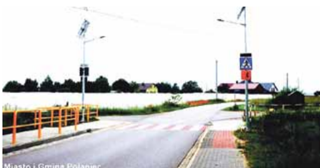
Miasto i Gmina Połaniec

2) „Przebudowa przejścia dla pieszych w ciągu drogi powiatowej nr 0822T Ruszcza - Słupiec w miejscowości Ruszcza” – wartość zadania: 116 308,80 zł