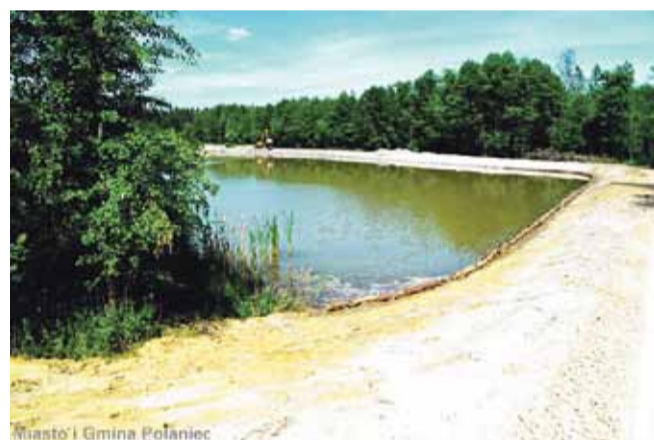
Miasto i Gmina Połaniec

Trwa realizacja zadania polegająca na: „Odmulaniu i czyszczeniu zbiornika wodnego w miejscowości Luszyca”. Jest obecnie na etapie końcowym prac. W ramach przedmiotowego zadania zrealizowano następujący zakres prac: