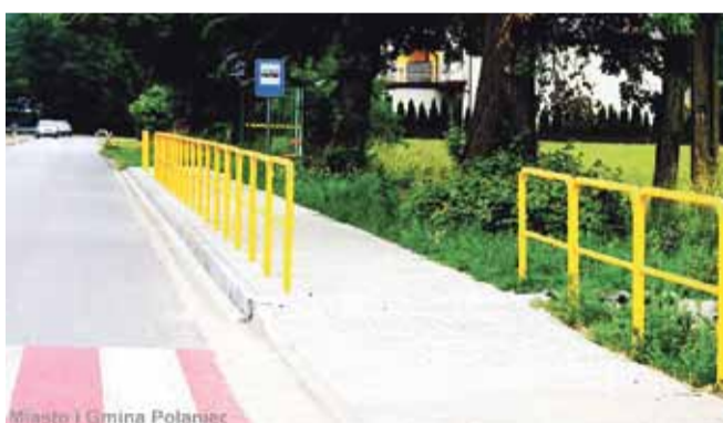
Miasto i Gmina Połaniec