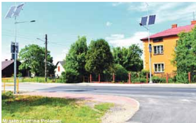
Miasto i Gmina Połaniec

Głównym celem projektu, który udało się osiągnąć to przede wszystkim zwiększenie bezpieczeństwa pieszych poruszających się po drogach naszej gminy. Wykorzystanie nowoczesnych możliwości technologicznych przy tworzeniu przejść dla pieszych znacznie poprawia ich widoczność, co owocuje wzrostem świadomości w zakresie bezpiecznego przejścia.