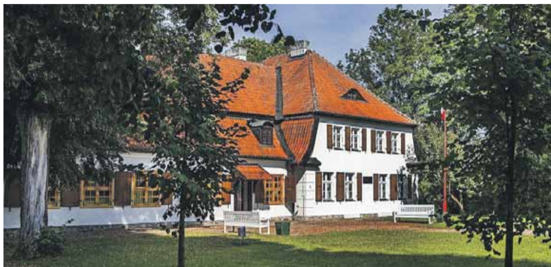
Muzeum Hymnu Narodowego w Będominie.

„Mazurek Dąbrowskiego” stał się wzorem dla hymnów innych państw.