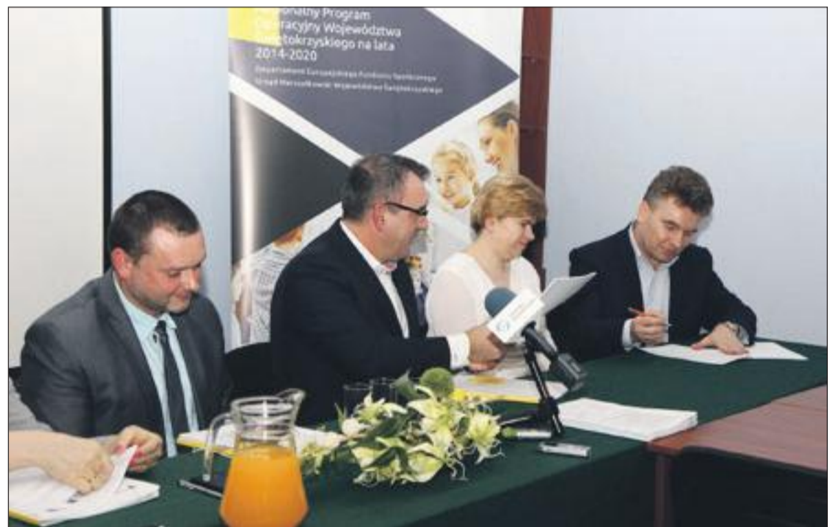
Podpisanie umowy na realizację zadania

Projekt współfinansowany ze środków Unii Europejskiej w Ramach Europejskiego Funduszu Społecznego, kwota całkowita 1 986 473,20, dofinansowanie 1 671 833,20 zł, wkład własny 314 640,00 zł.