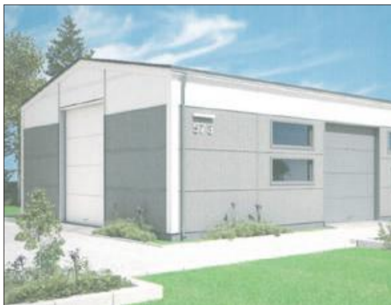
Wizualizacja hali z przeznaczeniem pod warsztat samochodowy na ul. Zielińskiego w Połańcu