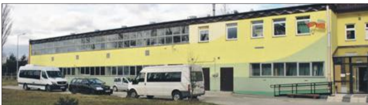
Widok na budynek WTZ – część obecnie użytkowana i część do adaptacji