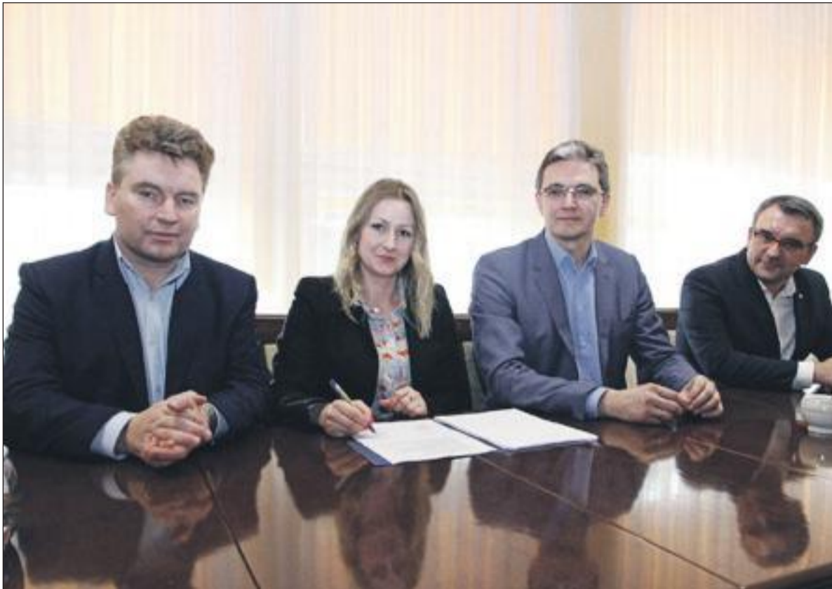
Podpisanie umowy na realizację zadania