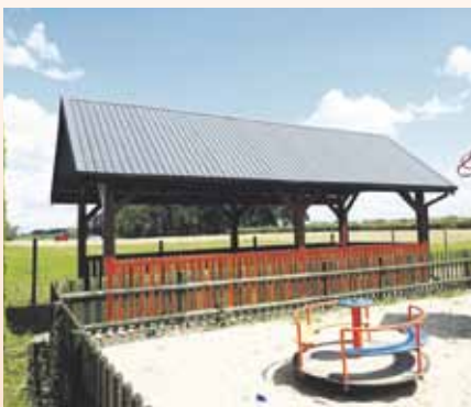
RUSZCZA KĘPA 36 861,14 zł brutto

KWOTY REALIZACJI ZADAŃ I EFEKTY PRAC PRZEDSTAWIAJĄ SIĘ NASTĘPUJĄCO: