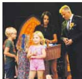
Nagrody dla najmłodszych.