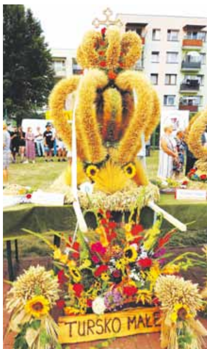
Zwycięzcą tegorocznego konkursu został wieńiec wykonany przez mieszkańców sołectwa Turisko Małe Kolonia i będzie reprezentował naszą gminę na Dożynkach Powiatowych.