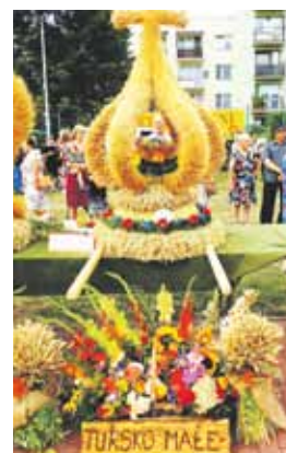
Drugie miejsce Turisko Małe