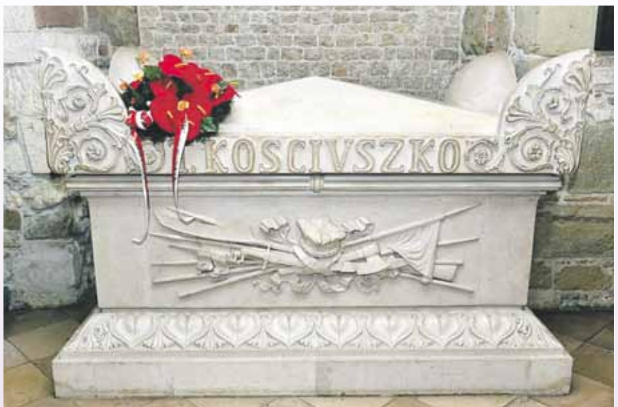
Sarkofag Tadeusza Kościuszki w krypcie św. Leonarda w katedrze wawelskiej.

mii będą chłopci, ale chłopci wolni, mający pełnię praw jako obywatele swojego kraju, w pełni odpowiedzialni za losy swojego państwa i narodu! Kościuszko sprzeciwiał się porządkowi feudal-