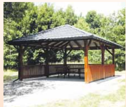
BRZozowa 39 433,60 zł brutto