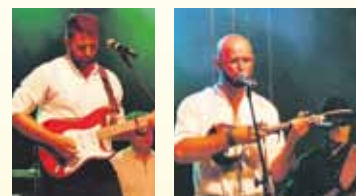
Gwiazdą wieczoru był zespół góralski „Parzenica”.