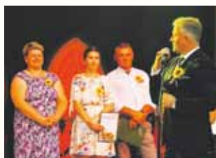
Podziękowania dla Koła Gospodyń Wiejskich.