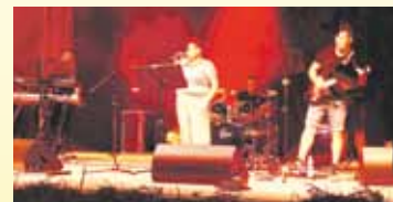
Na zakończenie dożynek odbyła się „zabawa pod chmurką” przy rytmach zespołu „Retro Band”.