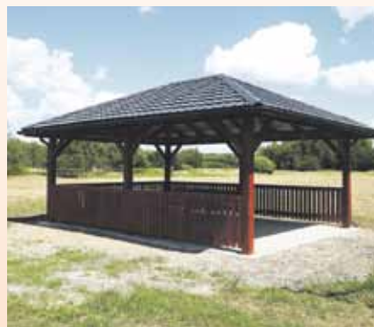
KAMIENIEC 39 433,60 zł brutto