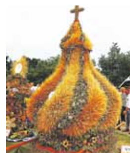
Trzecie miejsce sołectwo Wymysłów